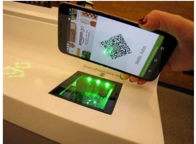
Casse in cui esibire il codice per entrare

quindi se arriveranno anche da noi in Italia, ma Amazon non dà riscontri. Noi però rimaniamo fiduciosi e al passo con tutte le novità!