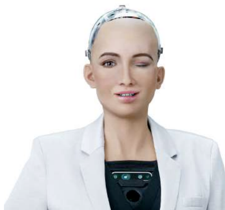
Sophia di Hanson Robotic

Possono avere un impatto positivo, perché possono rappresentare un grande aiuto per l’uomo, come poter fare interventi in ambito della medicina preven-