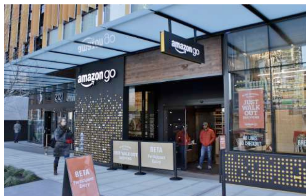
Amazon Go (Seattle)

smartphone e infine l’app Amazon-Go. A questo punto ogni cliente, per accedere al punto vendita, deve esibire davanti ad un apposito lettore lo smartphone con il proprio codice che