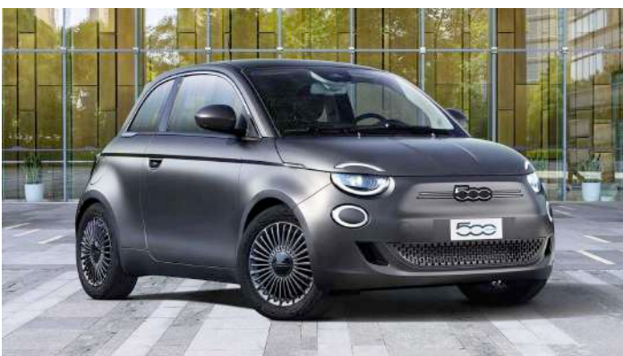
Fiat 500 elettrica

E poi, ci sono altri costi da considerare; uno di questi?