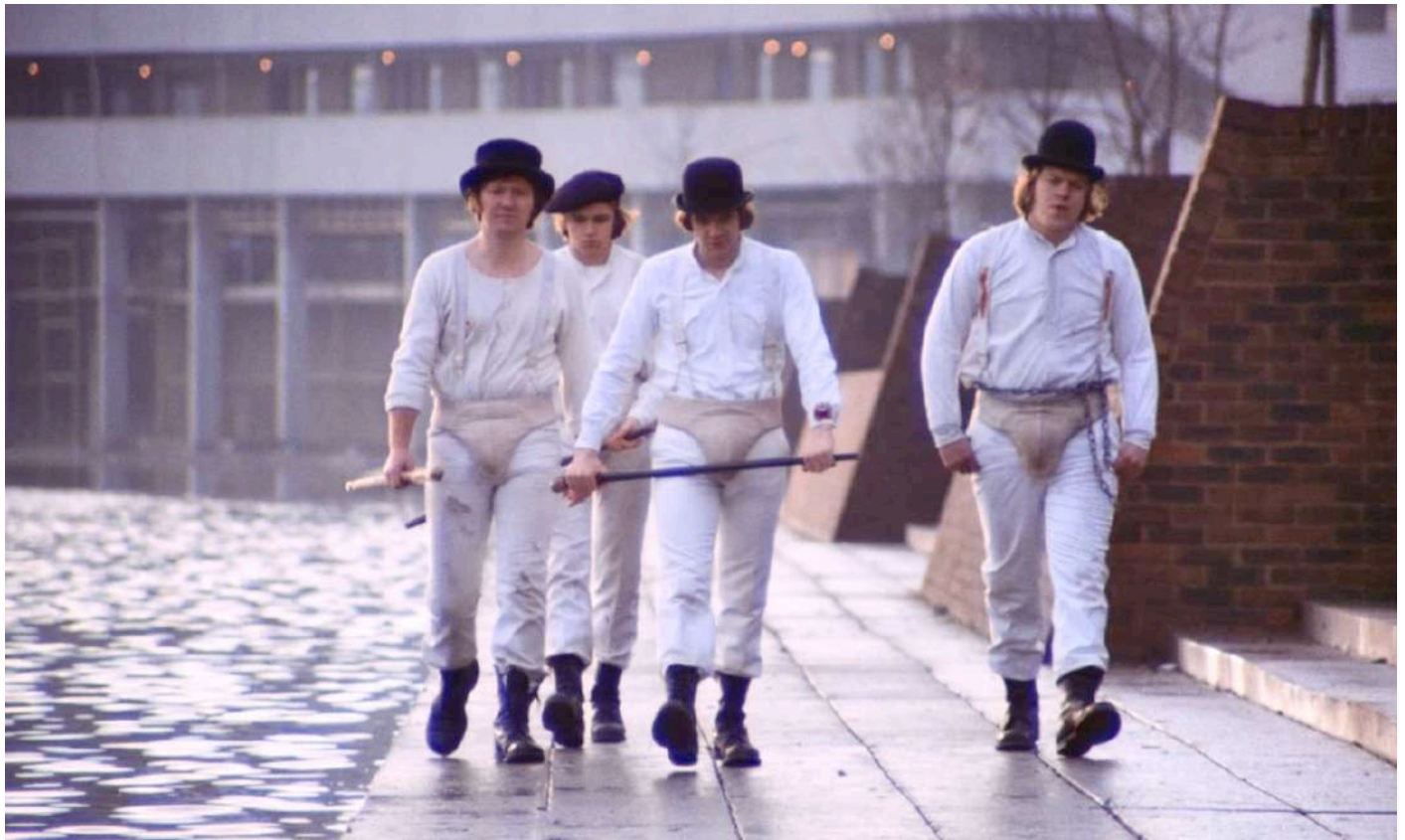
Alex DeLarge insieme ai Druggi

Alex stesso a scegliere di non essere più violento allora non è una vera buona azione, quindi lui non ha mai davvero soppresso la sua natura malvagia; è come un cane bastonato che ubbidisce soltanto finché il bastone lo minaccia e senza quello non esiterà ad attaccare. L'errore consiste nel rendere Alex senza libertà di scelta oltre che libertà di vita. La violenza è sbagliata ma è ancora più sbagliato privare un ragazzo qualsiasi di compiere le sue scelte (anche se sbagliate). Come diceva un personaggio del film, "se l'uomo non può scegliere smette di essere uomo".