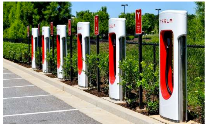
Colonnine per la ricarica

Non benissimo, ma decisamente meglio, no?